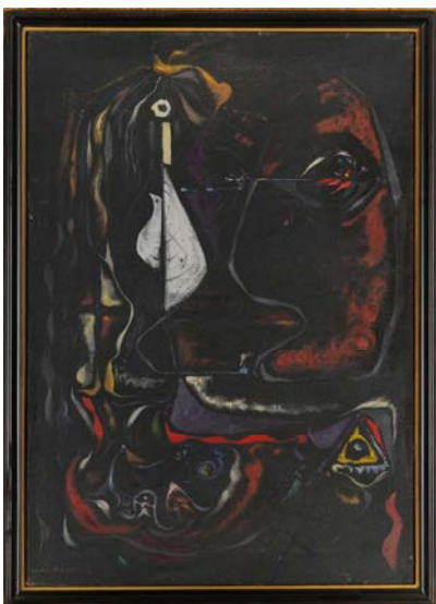
André Masson, La Sorcière, 1942, huile et tempera sur toile, 72 x 51 cm, Paris, Comité André Masson.