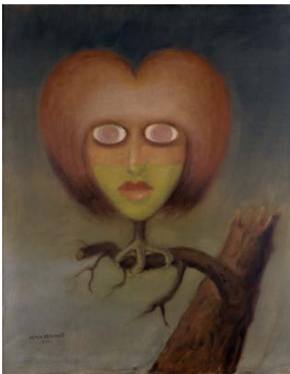
Victor Brauner, Chimère , 1939, huile sur toile, 73 x 60 cm, Strasbourg, Musée d'Art moderne et contemporain.

Réunissant quelque 500 œuvres, 150 objets scientifiques, 150 livres et une centaine de documents, provenant de 25 pays européens, L'Europe des Esprits se développe au sein du Musée d'Art moderne et contemporain de la Ville de Strasbourg sur plus de 2000 m 2 .