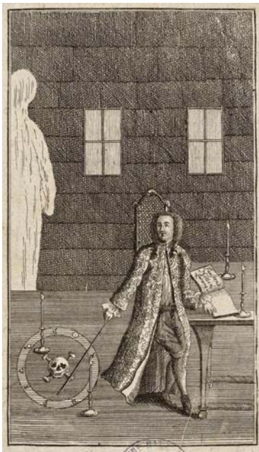
Frigander. Geschichte von einigen Gespenstern, welche sich in unterschiedlichen Orten geäuset, und ihr Anliegen offenbart haben.... M. C. N. Naumann. Gedanken von den sichtbaren Erscheinungen der Geister. Francfort/Main ; Leipzig : s. n., 1754. Frontispice.