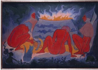
Paul-Elie Ranson, Les Sorcières autour du feu , 1891, huile sur toile, 38 x 65 cm, Saint-Germain-en-Laye, Musée Départemental Maurice Denis « Le Prieuré ».

« L'Europe des esprits ou la fascination de l'occulte, 1750-1950 », est une exposition pluridisciplinaire qui explore l'emprise de l'occulte chez les artistes, penseurs, écrivains et savants, dans toute l'Europe, au fil des époques décisives de l'histoire de la modernité. L'exposition est organisée en trois volets qui traitent respectivement :