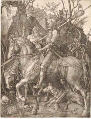
Albrecht Dürer (Nuremberg 1471 - 1528), Le Chevalier, la Mort et le Diable, Gravure au burin, 1513, Strasbourg, Cabinet des Estampes et des Dessins.